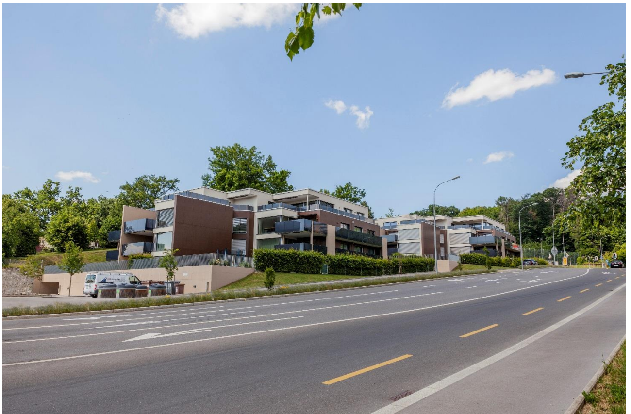
Route du Mont 1 + 3 - 1008 Prilly - «L'Orée du Parc»